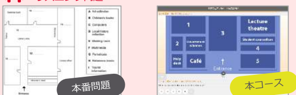
▲左が本番で出題される「図表完成問題」、右が本コースのレッスン