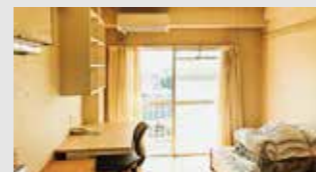
国際交流会館単身室