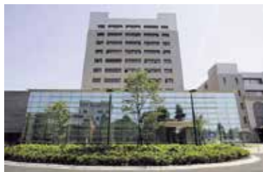
工学部百周年記念館