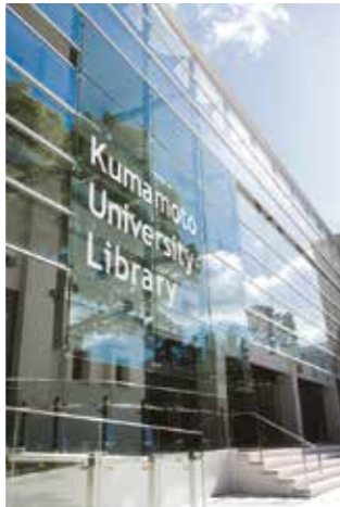
熊本大学附属図書館